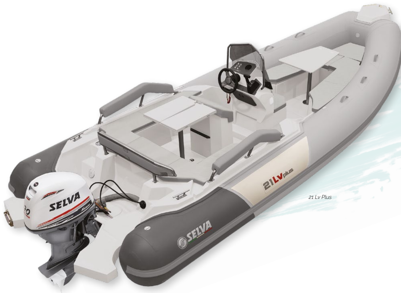
21 Lv Plus