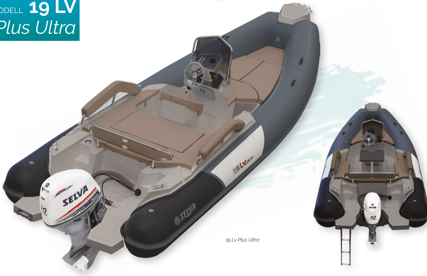
19 Lv Plus Ultra