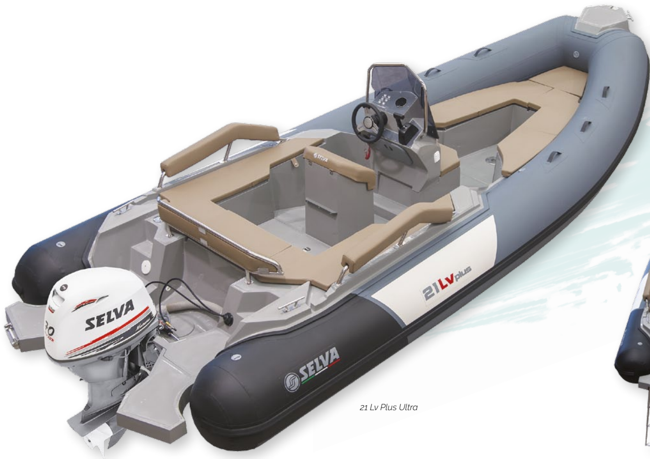
21 Lv Plus Ultra